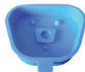
Moyen L83 x l 64 mm