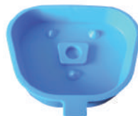
Grand L92 x l 72 mm

Réf. 692P Petit modèle 1 Pièce 23.00 € TTC