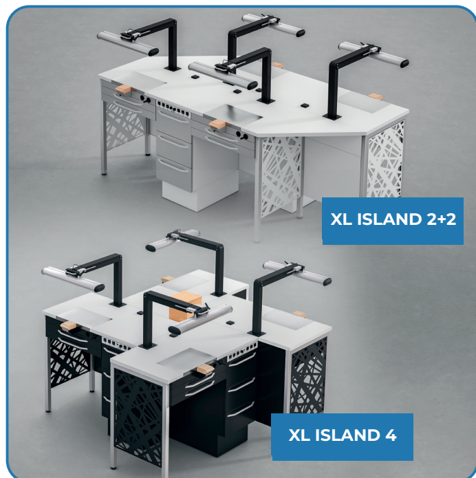
XL ISLAND 2+2